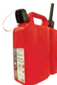
Jerrican plastique double compartiment 3 L + 1,5 L Bec verseur rigide Rel. 12203