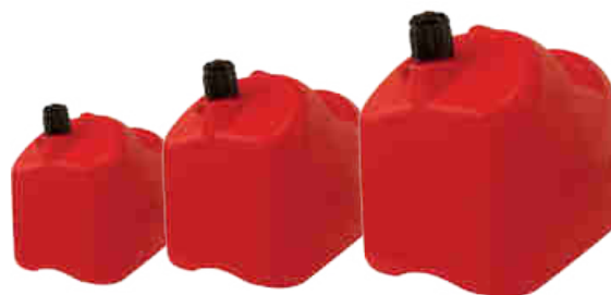
Jerrican plastique 5 L Bec verseur rigide RÉF. 12205