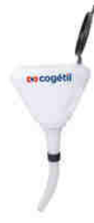
1,7 L - RÉF. 12426 3 L - RÉF. 12427