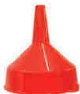
Entonnoir 195 mm RÉF. 12421