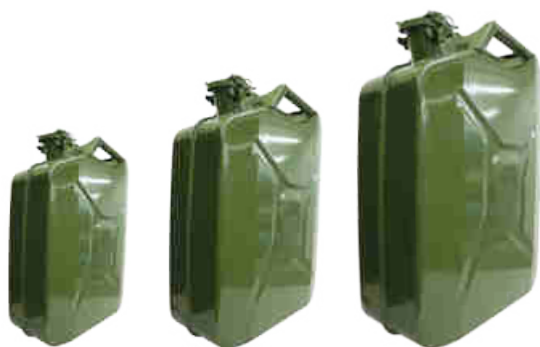
Jerrican tôle renforcée 5 L RÉF. 12105