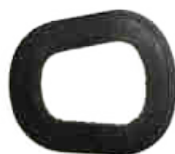
JOINT RÉF. 12101