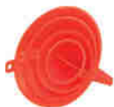
Lot de 4 entonnoirs RÉF. 12420