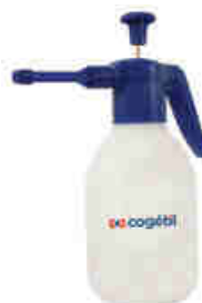
Pulvérisateur pression 2 L Buse réglable et joints viton pour produits détergents RÉF. 12231