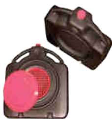
Bac de vidange 14 L RÉF. 12430